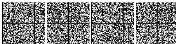
Tabella V.7-3: Livello di prestazione per controllo dell'incendio